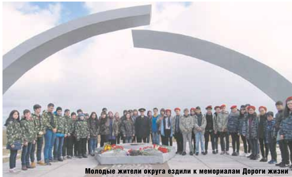
Молодые жители округа ездили к мемориалам Дороги жизни

Более 2200 человек приняли участие в мероприятиях по профилактике наркомании и курения, дорожно-транспортного травматизма и правонарушений. Среди новых мероприятий по профилактике наркомании наибольший отклик нашли музыкально-драматическая композиция «Белые шары» и профилактический тренинг «Альтернатива есть».