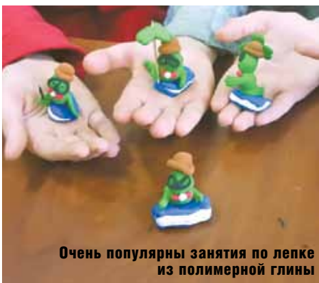
Очень популярны занятия по лепке из полимерной глины