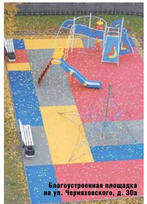
Благоустроенная площадка на ул. Черняховского, д. 30а

В отчетном периоде увеличилось количество обращений по опеке и попечительству, по благоустройству, напротив, незначительно уменьшилось. Однако это не означает снижения интереса жителей к теме создания комфортной среды. По вопросам благоустройства граждане стали чаще обращаться посредством портала «Наш Санкт-Петербург». За 2017 год на портал поступило 79 обращений по данной тематике. По 39 обращениям работы были произведены в 2017 году, а по оставшимся 40 — соответствующие работы предусмотрены в рамках ведомственной целевой программой по благоустройству на 2018 год.